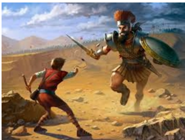
David lançant un galet sur Goliath.

« Ouvre mes yeux, pour que je puisse contempler les merveilles de ta Torah ! » (Tehilim / Psaume de David 119:18)